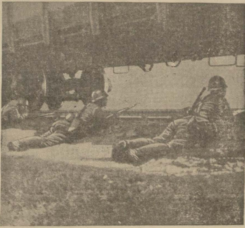
Bir demiryolu üzerinde dövuşen Japon askerleri

Bu tedbirler cümlesinden olarak yağ istihlak edilen muntakalarda ihtiyaçtan fazla yağlara valiler tarafından el konulacak ve bunların miktarı hükümete bildirilecektir.