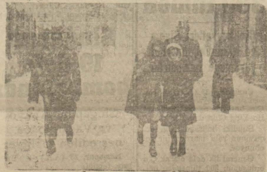
Şehrin dünkü hali

Münakalât müşkülâtla yapılabiliyor, karın irtifa 30 santimi geçti, hararet derecesi nakıs 5 ti